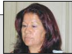
d. Graciela Camaño Ministro de Trabajo