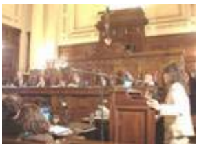
Escena de una audiencia pública ante la Corte Suprema

En este sentido, la expresión de la sentencia que nos ocupa, “... Por lo demás, no se ha invocado, ni esta Corte lo advierte, la existencia de razón alguna que haga que la limitación impugnada resulte necesaria en una sociedad democrática en interés de la seguridad nacional o del orden público, o para la protección de los derechos y libertades ajenos... ” es un poco inexplicable en tanto precisamente para ello es que se permiten los amicus . Tampoco la Corte convocó a audiencias públicas, procedimiento que está utilizando para considerar los casos más importantes y de interés público. Aquí cabe otra pregunta ¿podía la CSN hacer esto ante semejante tema? No es necesario imaginar la conmoción que hubiera provocado, con los camiones de Moyano rodeando a tribunales. En síntesis, creo que la CSN ha utilizado la prudencia en este caso.