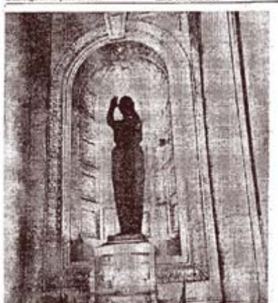
"Justitia", de Rogelio Yrribarra. (Vestibulo del Palacio de Tribunales)