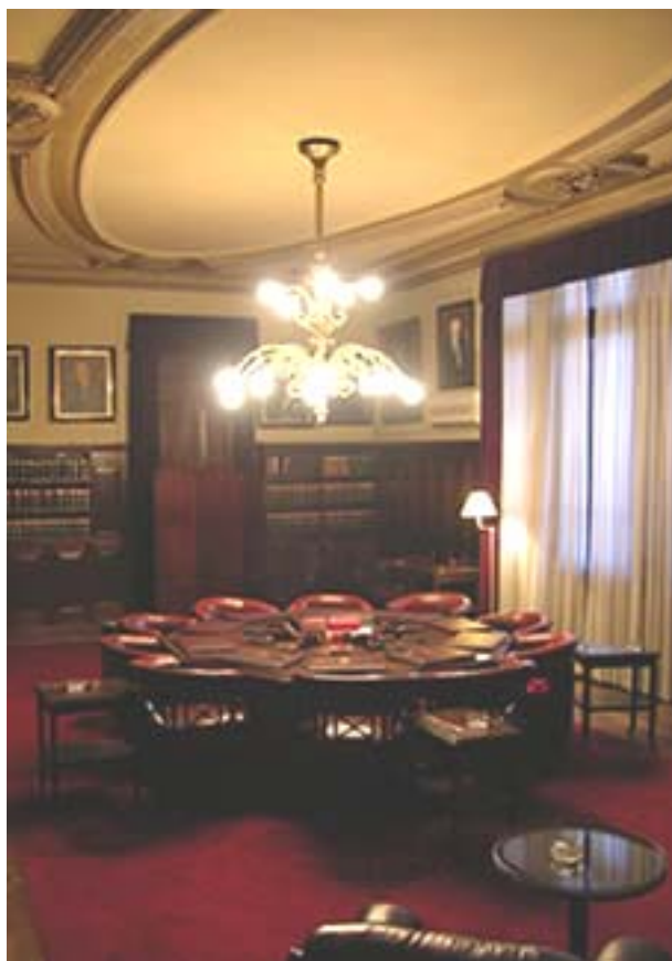
SALA DE ACUERDOS

Tribunal de origen: Sala IV de la Cámara Nacional de Apelaciones del Trabajo