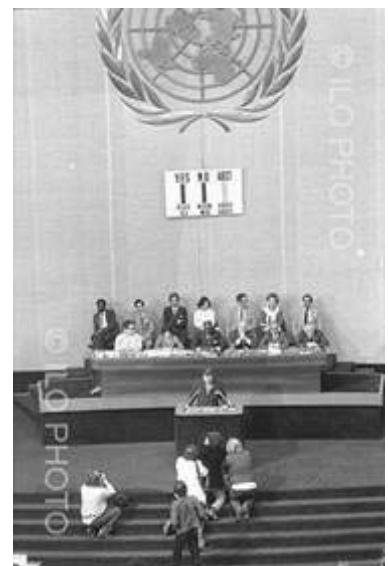
OUT - Conferencia Internacional del Trabajo, 67va sesión, junio 1981, discurso en la sesión plenaria dado por Lech Walesa (Delegado de los trabajadores, Polonia).